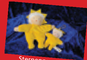
Sternenpuppen Zum Kuscheln (18 cm) 9,50 € und als Schlüsselanhänger (10 cm) 4,50 €