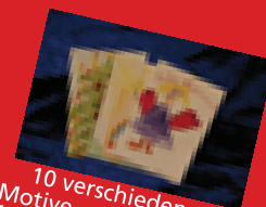
10 verschiedene Motive - von Kindern für Kinder gemalt (mit Kuvert) je 1,- €

Sie finden uns in der Adventszeit wieder im Hanseviertel in der Hamburger Innenstadt. Dort - wie auch in der „Sternenbrücke“ - können Sie unsere Sternepuppen, den Becher, die Weihnachtskarten, unseren Leinen-Beutel und die Humboldt-CD erwerben. Im Dezember jeweils Donnerstags und Freitags 11-19 Uhr