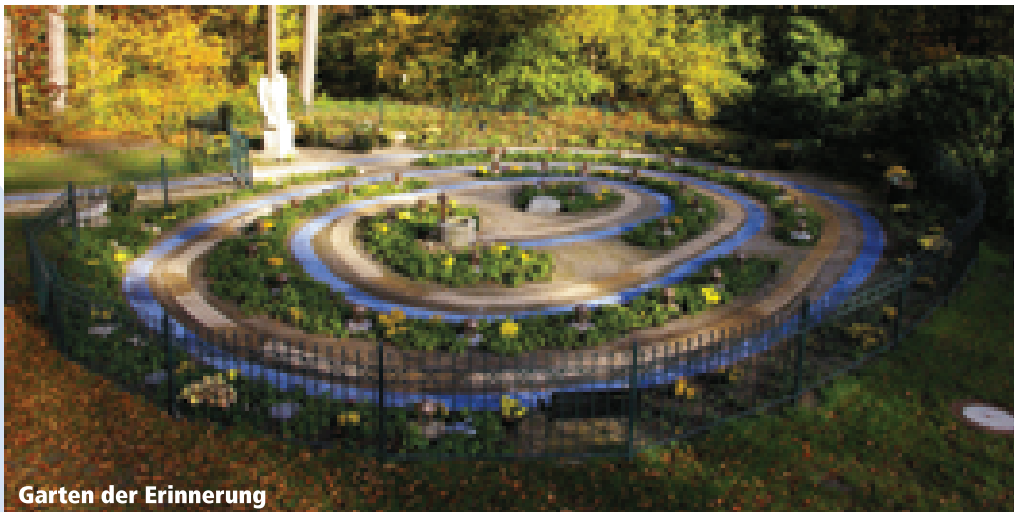
Garten der Erinnerung

Die Wochen seit der Eröffnung des Gartens haben uns gezeigt, dass die Familien dieses Ritual dankbar annehmen. Oft brennen abends Laternen und zeigen, dass jemand aus der Familie da war. Eine Schneekugel, ein bemalter Stein, ein Bild oder frische Blumen liegen bei dem roten stillen Licht. Die Eltern rufen an mit der Bitte, zum Geburtstag oder Todestag des Kindes die Kerze zu entzünden, wenn sie selbst zu weit weg wohnen. In vielen Gesprächen an diesem Nachmittag erzählten die Eltern mir, dass dieser Ort für sie eine „Gedenkstätte“ ist. Dass das Öffnen der kleinen Tür der Laterne ihres Kindes und das Anzünden der Kerze für sie eine besondere Bedeutung haben. Es öffnet sich eine Tür, ein Licht gibt Hoffnung in der Dunkelheit ihrer Trauer. Ein Licht als Symbol für einen Weg in ihr Leben, das trotz des Verlustes ihres Kindes ihnen irgendwann wieder lebenswert erscheinen