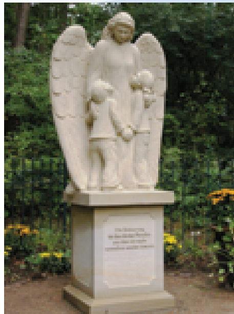
Engel im Garten der Erinnerung

Steinbildhauer Andreas Boldt enthüllten mit mir einen wunderschönen Engel aus Sandstein, der seine Arme beschützend um zwei Kinder legt. Er soll symbolisch über die Erinnerung an die Kinder wachen. Am Abend ist der Garten wunderschön beleuchtet und strahlt unter den alten Bäumen wunderbare Ruhe und Stille aus.