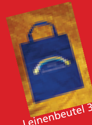
Leinenbeutel 3,- €