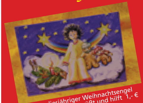
Unser diesjähriger Weihnachtsengel (Karte mit Kuvert) grüßt und hilft 1,- €