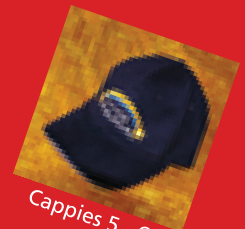
Cappies 5,- €